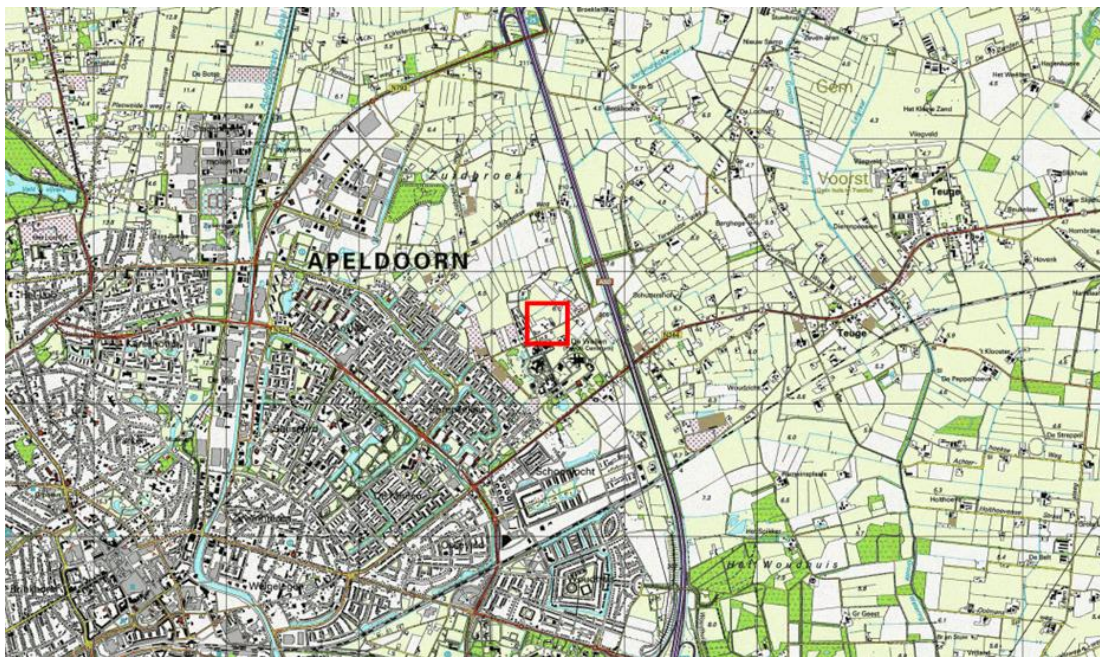
Figuur 1: Ligging plangebied (rood kader) binnen omgeving

Het bestemmingsplan Zuidbroek voorziet in het initiatief van de familie Smallegoor middels een wijzigingsbevoegdheid (artikel 3.3. lid 7 sub b van de planvoorschriften). Daarmee kunnen op de als zodanig aangewezen woonpercelen, onder voorwaarden, vrijstaande en halfvrijstaande woningen worden toegevoegd. Met toepassing van deze wijzigingsbevoegdheid is het voor de initiatiefnemers mogelijk om de extra woning te kunnen realiseren. Voor de tweede woning is de initiatiefnemer inmiddels gekomen tot een aanvraag bouwvergunning dat zowel voldoet aan de voorwaarden behorende bij de wijzigingsbevoegdheid als aan de redelijke eisen van welstand. Voor het vervangen van de gesloopte woning zal in de nabije toekomst een bouwplan worden ontwikkeld binnen de dan geldende kaders.